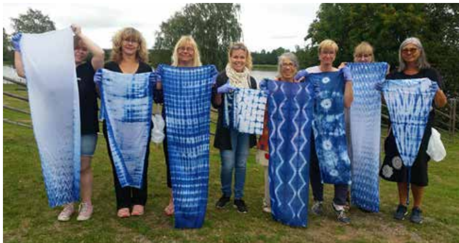
Foto från kursen Färga med indigo, Överkalix 2018.